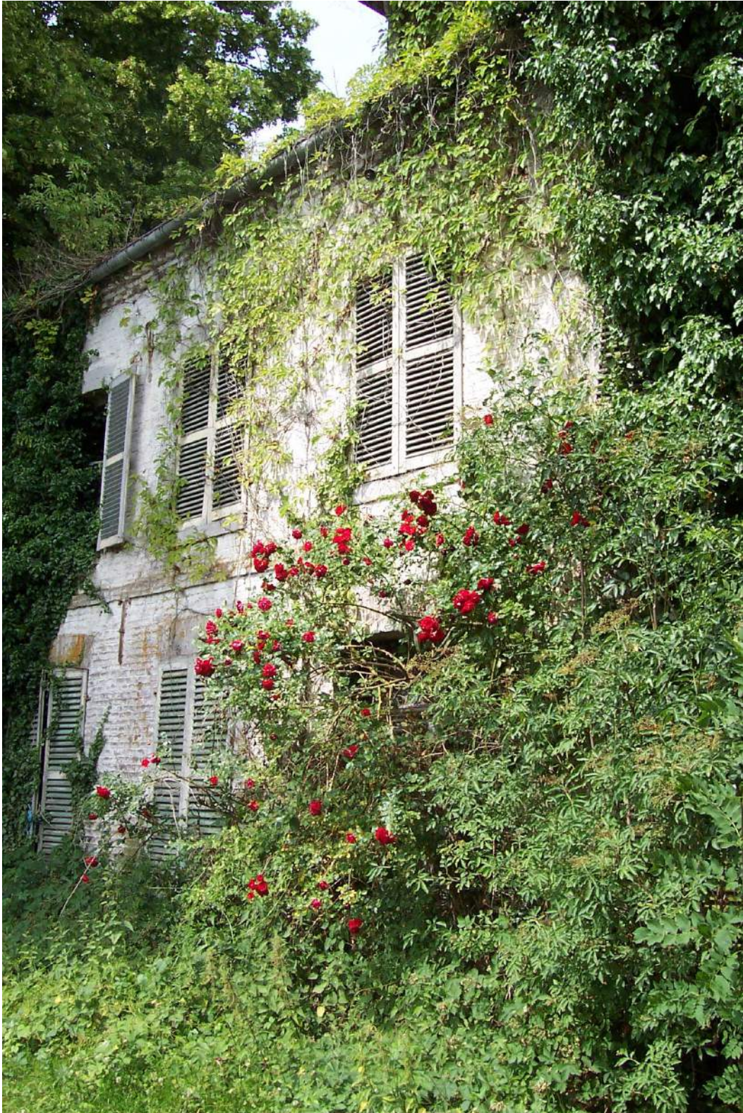
Ferme du Bois de Frémont, La Ferté-Chevresis