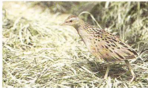
Le râle des genêts

Tout au long de son voyage, l'Oise serpente paisiblement au milieu des bruissantes peupleraies et des vertes prairies.