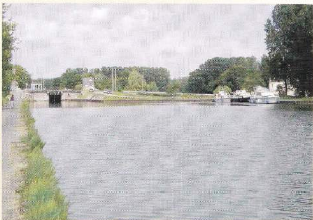
Le canal de la Sambre à l'Oise à Ribemont