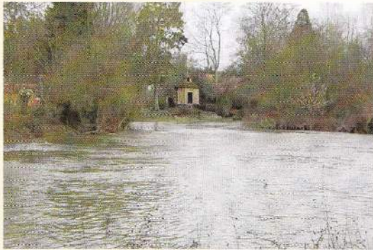
La rivière Oise à Mézières-sur-Oise